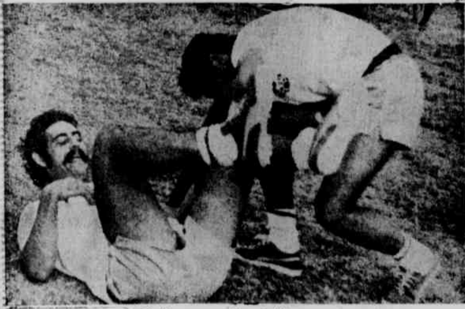
Rivelino apura a formá física

E o Flamengo continua pagando — com cheque com fundos, sim senhor — Hoje, nas plagas baianas, com um amistoso, sai mais uma grana para o Vitória, pela cessão do pequenino mas resolve.