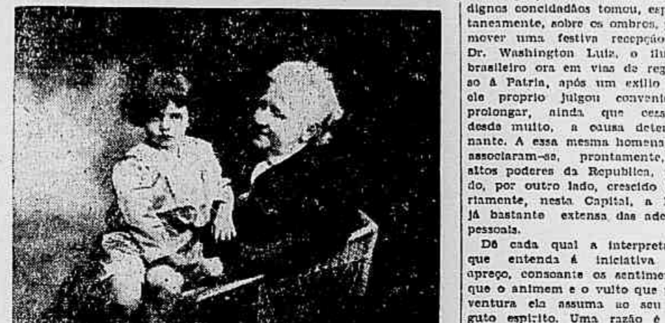
A Princesa Isabel, a Releitorora, tendo ao lado o Príncipe D. Pedro Henrique, seu sucessor nos direitos eventuais à Coroa brasileira