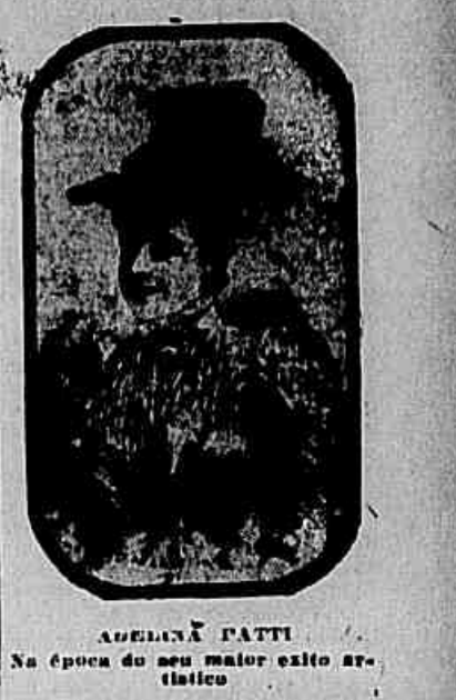
Adelina Patti Na época do seu maior exito artistico