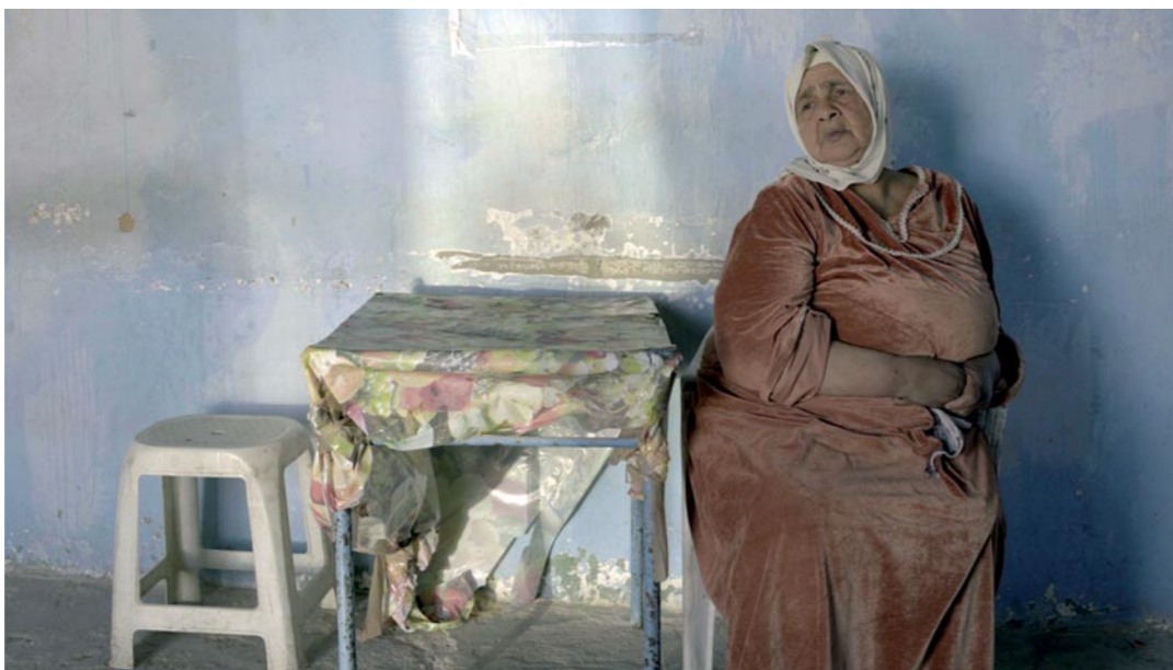
143 rue du désert