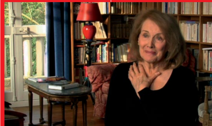
Les Mots comme les pierres. Annie Ernaux, écrivain