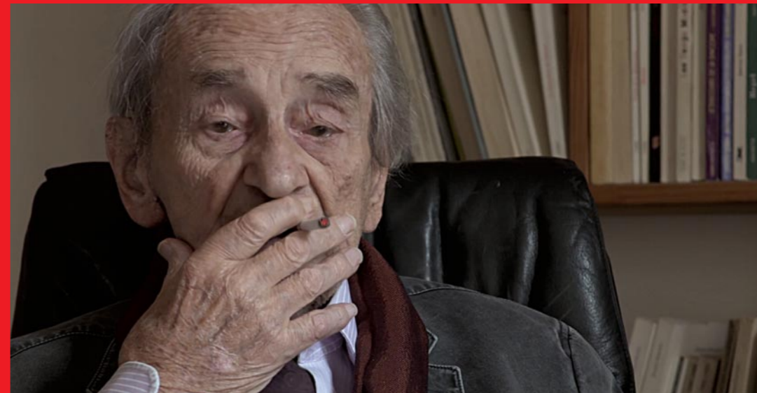
Comme si, comme ça