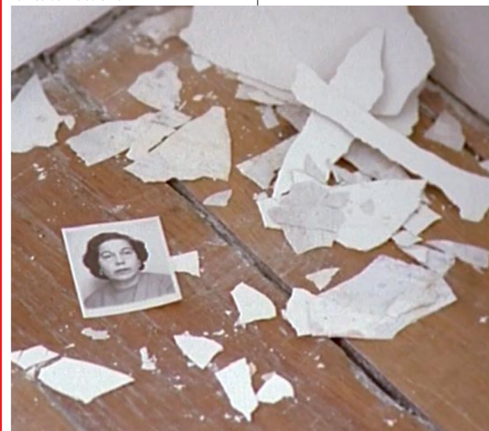
Le Lieu du mélodrame