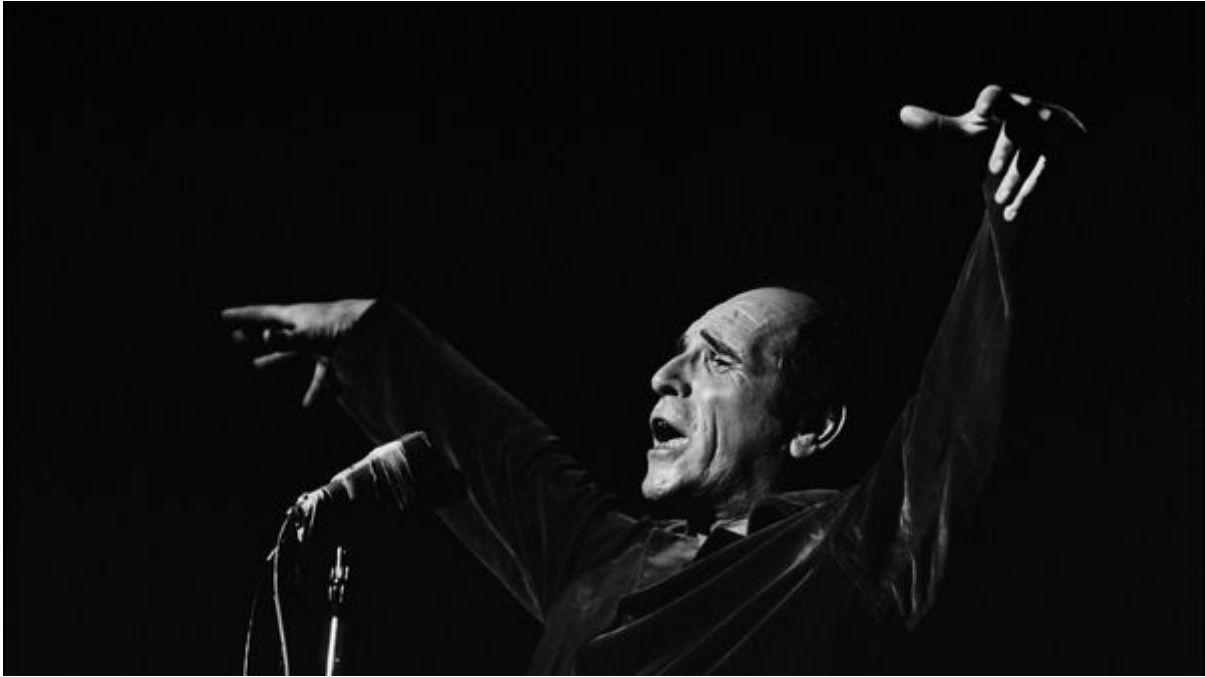
Léo Ferré sur scène en 1967

En novembre 1975, Léo Ferré réalise son rêve en dirigeant les musiciens de l'Orchestre Padeloup sur la scène du Palais des Congrès pour une série de concerts dans un programme où se mêlaient des œuvres du répertoire classique et ses propres chansons ...A cette occasion, Claude Maupomé le recevait sur les ondes de France Musique pour son émission « Le Concert égoïste »