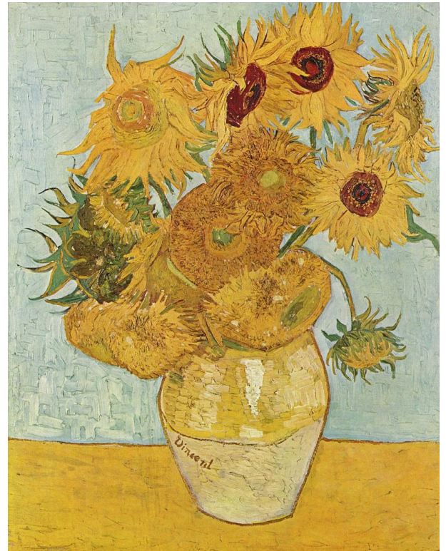
Illustration 3: Vincent Van Gogh, Les tournesols , été 1889, huile sur toile - 95 x 73 cm, Van Gogh Museum Amsterdam, Pays-Bas