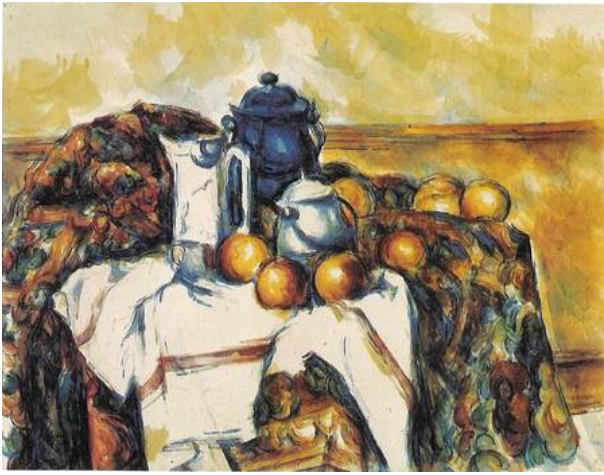
Illustration 4 : Paul Cézanne, Nature morte au pot de lait bleu , entre 1900 et 1906, graphite et aquarelle sur papier, 46 x 61,5 cm. Non localisée