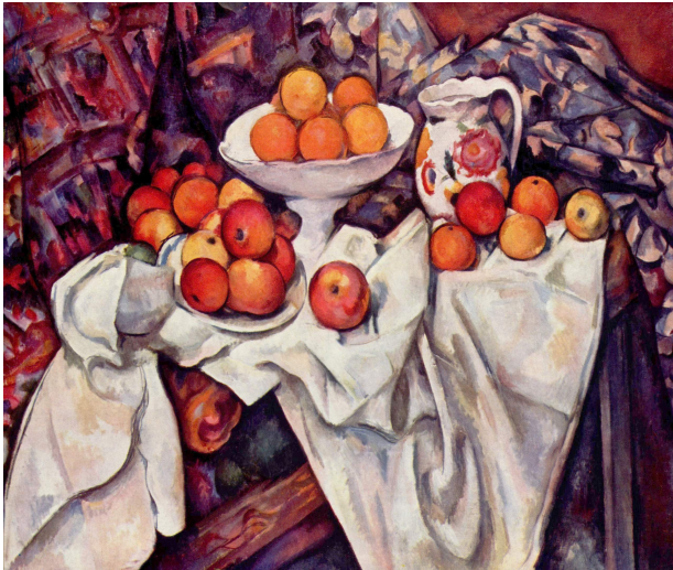
Illustration 1: Paul Cézanne, Nature morte aux pommes et oranges , vers 1899. huile sur toile, 74 x 93 cm. Musée d'Orsay, Paris

Illustration 7 : Martin Dichtl, Nature morte avec ustensiles de cuisine , 1710, huile sur toile, 12 x 18,5 cm. Non localisée