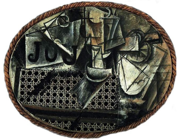
Illustration 5 : Picasso, Nature morte à la chaise cannée , 1912, huile et toile cirée sur toile encadrée de corde, 29 x 37 cm, Musée Picasso, Paris