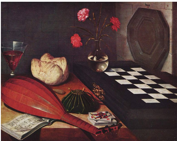
l'échiquier ou les cinq sens , 1630, huile sur bois, 55 x 73 cm, Le Louvre

Illustration 2 : Lubin BAUGIN, Nature morte à