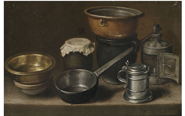
Illustration 7 : Martin Dichtl, Nature morte avec ustensiles de cuisine , 1710, huile sur toile, 12 x 18,5 cm. Non localisée