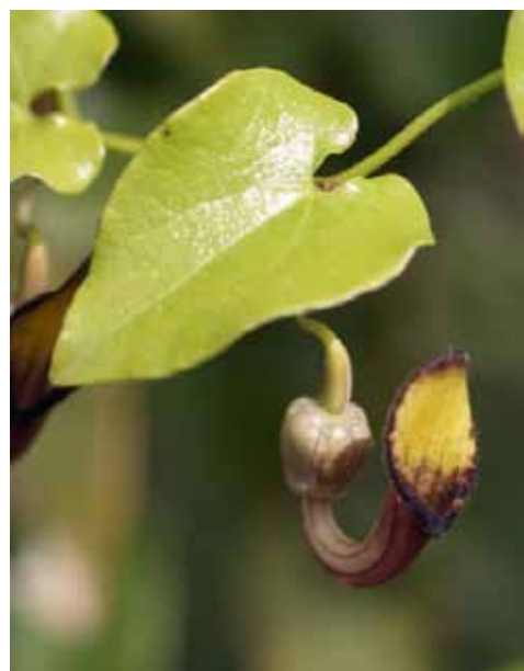
Fig. 4: Aristolochia microstoma , Egio (Péloponnèse), 20.04.2002. Fig. 5: A. elongata , Kato Lousi (Péloponnèse), 10.05.2002. Fig. 6: A. sempervirens , Egio (Péloponnèse), 20.04.2007.