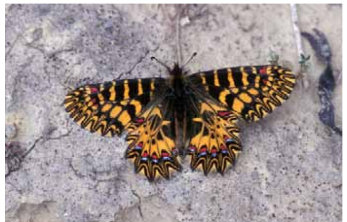
La f. ochracea en Grèce. Fig. 19: Diakopto (Péloponnèse), 26.03.2002. Fig. 20: Skourochori (Péloponnèse), 8.04.2000.