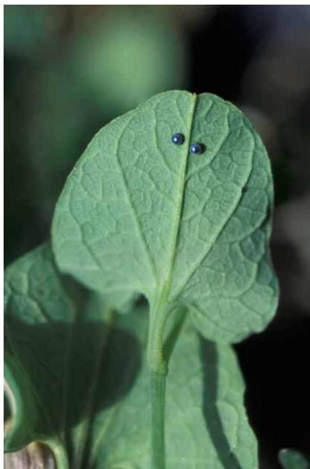
Fig. 11: oeufs sur A. elongata , Kato Lousi (Péloponnèse), 1000 m, 10.05.2002.