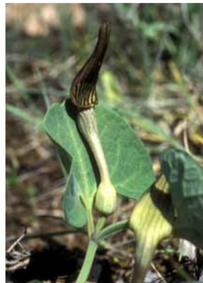
Fig. 1: Aristolochia clematitis , Vironia (Macedoine), 5.07.2008. Fig. 2: A. rotunda , Diakopto (Péloponnèse), 26.03.2002. Fig. 3: A. pallida , Driovouno (Macédoine), 1.05.2005.