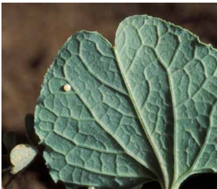
Fig. 10: oeufs sur Aristolochis microstoma , Egio (Péloponnèse), 1300 m, 12.05.2005.