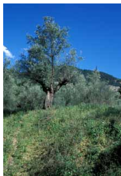
Habitats larvaires. Fig. 7: sur Aristolochia sempervirens , Diakopto (Péloponnèse), 19.04.2005. Fig. 8: sur A. pallida , Driovouno (Macédoine), 1.05.2005. Fig. 9: sur A. rotunda , Egio (Péloponnèse), 8.05.2005.