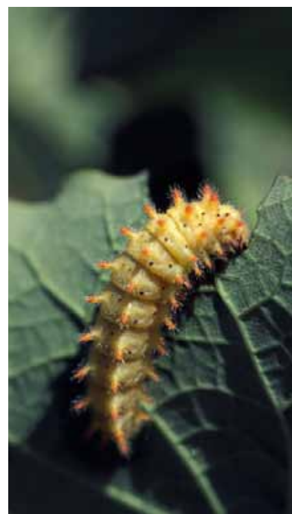
Fig. 12: jeune chenille sur Aristolochia , Paradiso (Macédoine), 28.04.2001. Fig. 13: chenille mature sur A. elongata , Avantas (Thrace), 5.05.2001. Fig. 14: chenille de Zerynthia cerisyi pour comparaison, sur A. clematitis , Mesta (Bulgarie), 15.07.2000. La pointe des scoli est noire chez polyxena , orange chez cerisyi .