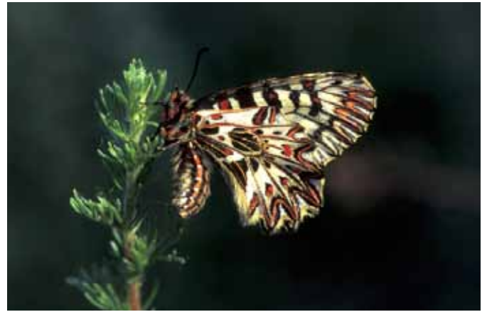
Fig. 17: femelle, Egio (Péloponnèse), 7.03.2002. Fig. 18: femelle, vallée du Nestos (Macédoine), 28.04.2001.