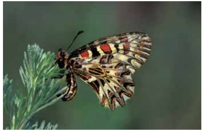
Fig. 15: mâle, Skourochori (Péloponnèse), 8.04.2000. Fig. 16: mâle, vallée du Nestos (Macédoine), 28.04.2001.