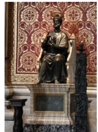
Statue de Saint-Pierre Rome chrétienne

La statue de Saint Pierre représente Saint Pierre, un apôtre de Jésus-Christ et le premier pape de Rome. Elle a été réalisée en bronze. Ici, Saint-Pierre tient les clefs de la porte du Paradis. Cette statue date du XIII ème siècle. Lorsque les pèlerins voient cette statue, ils l'embrassent et lui frottent toujours le même pied pour le vénérer. C'est pourquoi au cours du temps, ce pied touché sans cesse par les fidèles a subi une forme d'usure malgré le matériau utilisé.