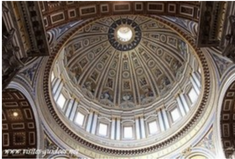
Coupole de la basilique

Quand il meurt, en 1564, à l'âge de 87 ans, la construction de la coupole est à peine engagée (elle ne sera achevée qu'en 1590). Si l'ouvrage est mené à bien en respectant la plupart des consignes du maître, le plan définitif adoptera... une croix latine ! La nef est en effet allongée pour accueillir le plus grand nombre de fidèles.