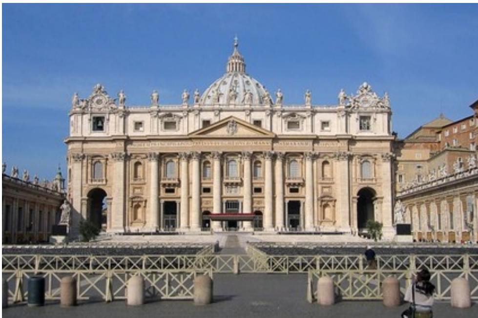
Façade de la basilique Saint-Pierre

Plus tard, c'est au tour de la façade de faire l'objet de controverses. Confiée à Carlo Maderno en 1607, elle sera poursuivie par Le Bernin, qui lui ajoute deux tours si impopulaires qu'elles seront démolies à peine édifiées. Cependant personne ne contestera à l'artiste la conception de la place.