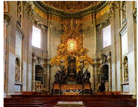
Chaire de Saint-Pierre et vitrail avec une colombe

Le baldaquin fut le premier travail du Bernin à Saint Pierre. Il surmonte l'autel principal. Il mesure 29 mètres de hauteur et pèse 60 tonnes. C'est la plus grande architecture de bronze du monde, et elle se trouve au centre de la basilique. Le baldaquin possède des colonnes torsadées et est situé au dessus du tombeau de St Pierre et de l'autel papal.