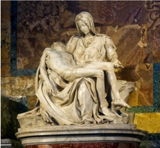
Pietà de Michel-Ange

La statue de marbre de La Pietà a été réalisée par Michel-Ange. Elle représente la Vierge Marie douloureuse tenant sur ses genoux le corps de son fils, Jésus-Christ, descendu de la croix après sa crucifixion et avant la mise au tombeau, ainsi que sa résurrection et son ascension.