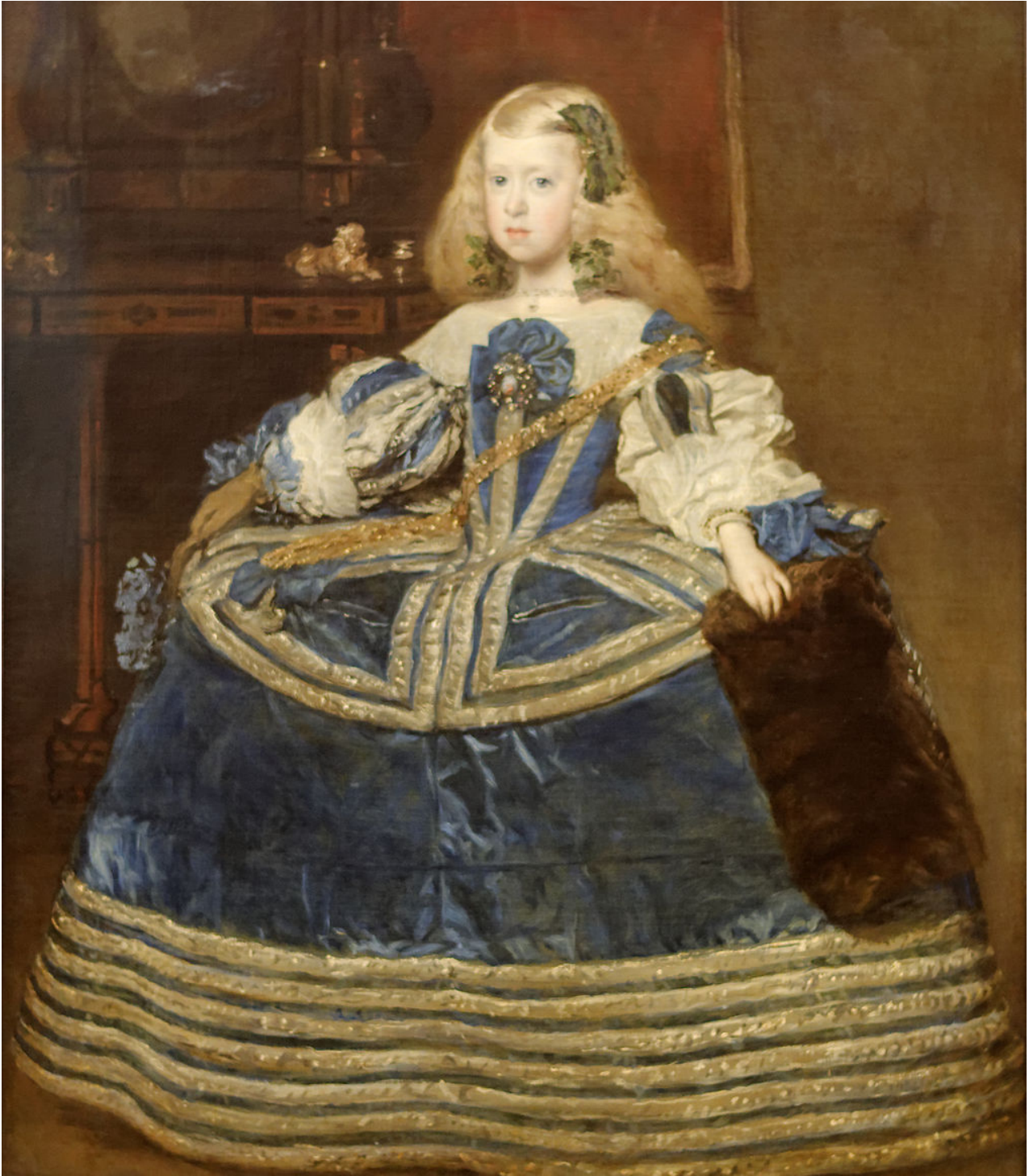
Marguerite Thérèse d'Autriche