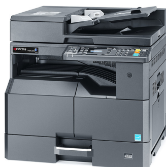
TASKalfa 180 avec DP-480