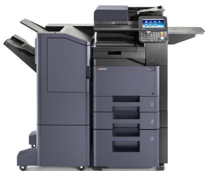
TASKalfa 406ci avec option