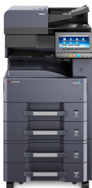
TASKalfa 3212i avec option