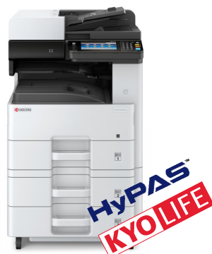
ECOSYS M4132idn Version 2