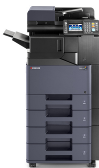
TASKalfa 306ci avec option