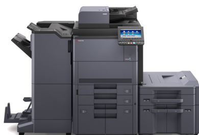
TASKalfa 8002i avec options