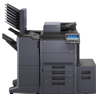
TASKalfa 8052ci avec options