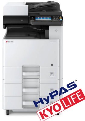
ECOSYS M8130cidn Version 2