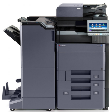
TASKalfa 6002i avec option