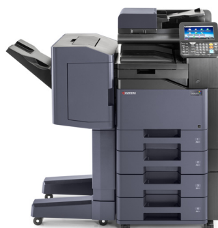
TASKalfa 356ci avec option