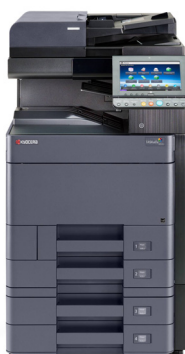
TASKalfa 3252ci avec option