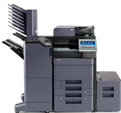
TASKalfa 6052ci avec Option